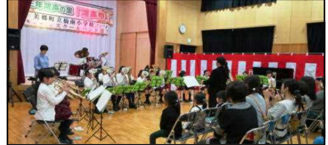
演奏するスクールバンドの皆さん