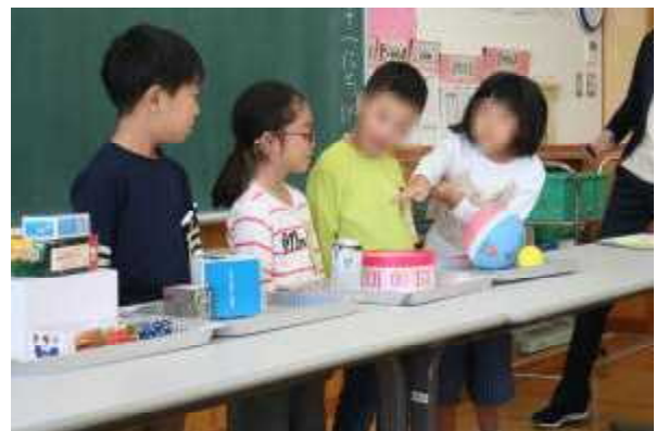
「みんなの前で分け方について説明」