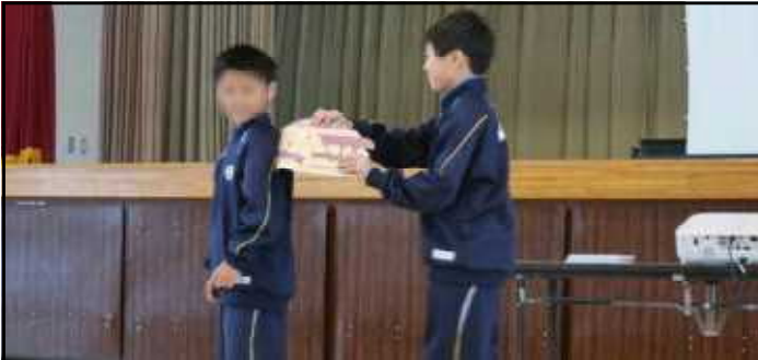
盛り上がったジェスチャークイズ