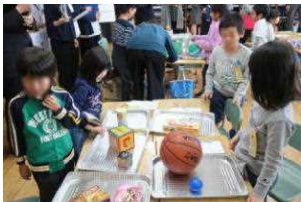
「グループで集めた箱などを分類」

また、1年2組は、算数の授業を1単位時間たっぷりと見ていただきました。家から集めてきた箱などの特徴をとらえて分類する学習でした。子ども達は、グループに分かれて「まんまるのかたち」「ほそながいまるのかたち」「ながしかくのかたち」「まししかくのかたち」などとネーミングしながら分類していました。授業中の集中力も増し、その成長ぶりに参観された先生方もびっくりされていました。