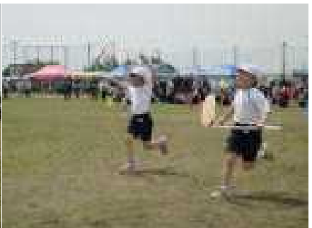
まわれ！ポン・デ・リング（2年生）

運動会最後の種目は、色別対抗リレーでした。最初は、3・4年生、次に5・6年生のリレーが行われました。バトンを受け取った人は、チーム全員の気持ちが込められたバトンを持って全力で走りました。たくさんの感動場面が見られた素晴らしい色別対抗リレーとなりました。