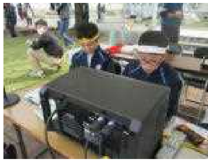
放送委員によるアナウンス