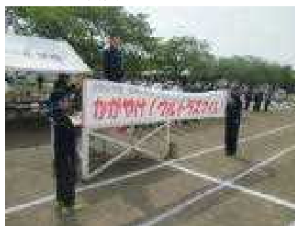
児童会テーマの発表