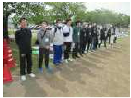
PTA会長さんと体育部の皆さん