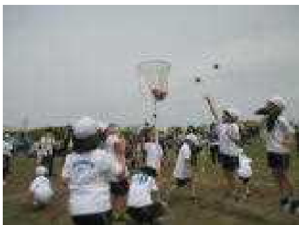
色別対抗玉入れ（1年生）

また、1・2年生は、色別対抗玉入れと新種目「まわれ！ポン・デ・リング」でもお家の皆さんから大きな声援をもらい、楽しく競技に取り組んでいました。