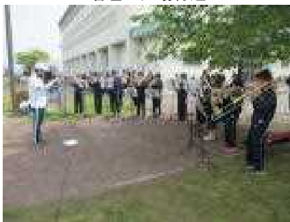
スクールバンド部の見事な演奏