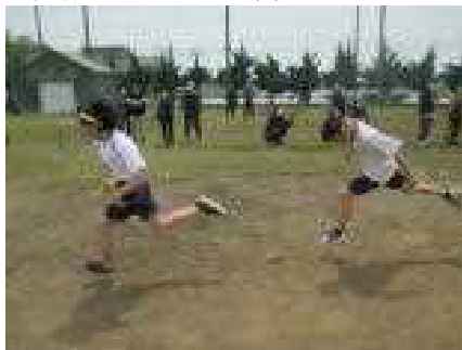
後はたのむ…（5・6年生リレー）