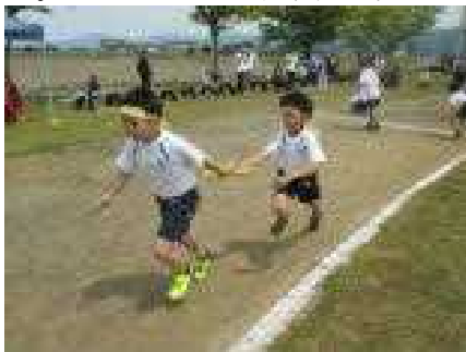
見事なバトンパス（3・4年生リレー）

運動会最後の種目は、色別対抗リレーでした。最初は、3・4年生、次に5・6年生のリレーが行われました。バトンを受け取った人は、チーム全員の気持ちが込められたバトンを持って全力で走りました。たくさんの感動場面が見られた素晴らしい色別対抗リレーとなりました。