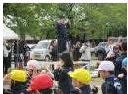
運動委員のリードによるラジオ体操

プログラム前半は100M走と80M走です。1年生は、初めての運動会で少しドキドキしたようですが、小学生らしい力強い走りを見せてくれました。他の学年も体育で学習した成果が十分発揮され、昨年よりフォームもスピードもレベルアップした素晴らしい走りで見事にゴールしていました。